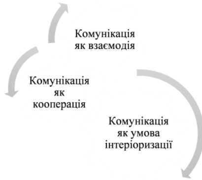
Рис. 1.1 – Три види основних аспектів комунікації

Процес формування КВ у школярів буде успішним, якщо реалізується сукупність педагогічних умов: сприятливий психологічний клімат у дитячому колективі, атмосфера доброзичливості та створення ситуації успіху для кожної дитини; спільна діяльність школярів на основі задоволення потреб у спілкуванні у позаурочний час; включення школярів до системи ситуацій взаємодії з вчителями, однолітками та дорослими; набуття учнями теоретико-прикладних знань з проблеми спілкування та взаємодії з людьми у повсякденній, навчальній та позанавчальній діяльності. На нашу думку, саме ці педагогічні умови сприяють формуванню КВ в дітей старшого шкільного віку.