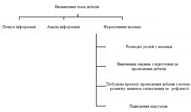
Рис. 1.4 – Алгоритм проведення дебатів «Дебатного клубу».

Також доцільно буде зобразити схематично алгоритм проведення дебатів в 11 класі на уроці англійської мови (рис. 1.4).