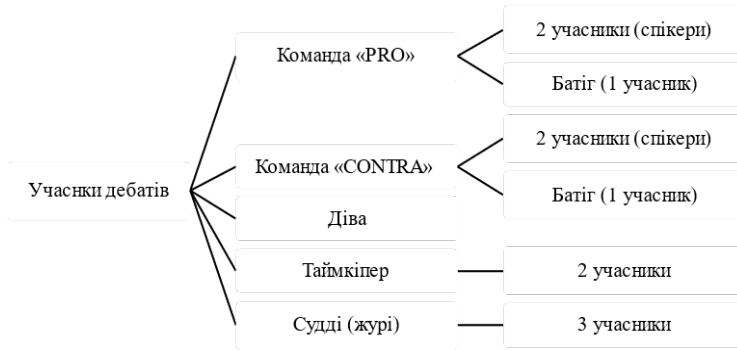
Рис. 1.3 – Учасники дебатів «Дебатного клубу»

На рис. 3.2 показано схему учасників дебатів «Дебатного клубу». Всього у дебатах прийняло участь 11 школярів СЗОШ.